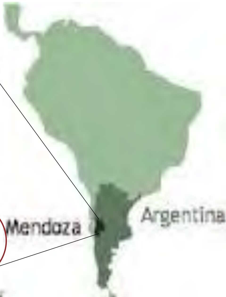
Malargüe: último departamento creado en 1950. Anteriores entre 1853 y 1914